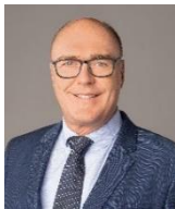
Martin Pfister Regierungsrat und Gesundheitsdirektor Kanton Zug Allenwinden