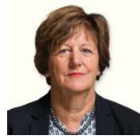
Ida Glanzmann-Hunkeler ehemalige Nationalrätin Präsidentin Die Mitte 60+ Schweiz Altishofen